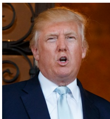
Ook toekomstig president Donald Trump werd verrast door de beslissing van zijn partijgenoten.

Dat orgaan werd in 2008 door de Democratische meerderheid in het Huis van Afgevaardigden opgericht om een einde te maken aan een reeks lobbychandalen, waarbij onder meer twee Republikeinen en een Democraat betrokken waren. Sindsdien onderzocht het OCE volledig onafhankelijk beschuldigingen over wangedrag